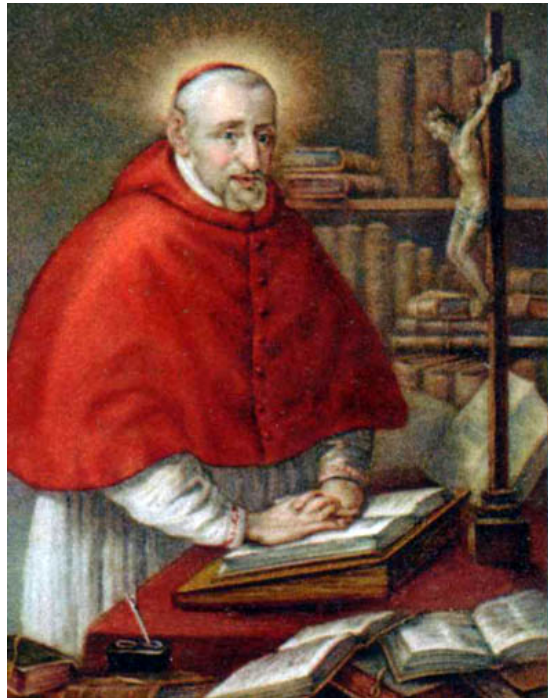
San Roberto Bellarmine Patrón de Catequistas & Catecúmenos Ruega por nosotros